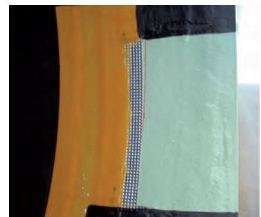
Die verschiedenen Arbeitsgänge auf einen Blick

Die Leckschutzauskleidung kommt vor allem bei einfachwandigen, erdverlegten, zylindrischen Tanks sowie bei oberirdischen Stehtanks zum Einsatz.