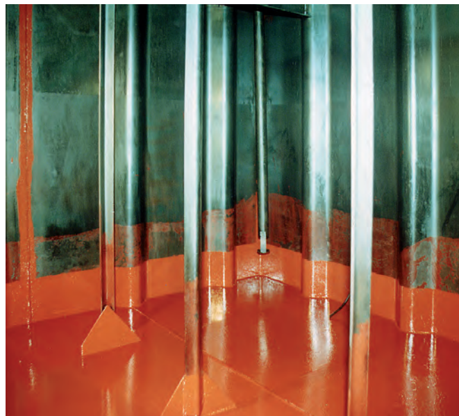
Der gereinigte Tankinnenraum nach der Revision